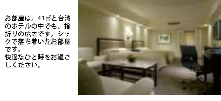
↑シャーウッド客室一約(約41㎡)