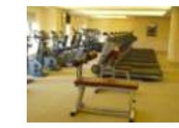
↑シャーウッドジム