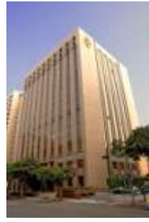
↑シャーウッド外観

世界のVIPから高い評価を受ける一流ホテル。 台湾交通部観光局によるホテルランク付け5つ星獲得。 プライバシーを重視した館内と行き届いたサービス で御客様をお迎え致します。 ★MRT中山国中駅まで徒歩8分