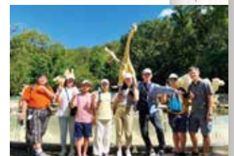
アイランドホッピング等