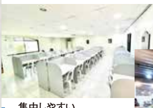
集中しやすい自習室は複数有