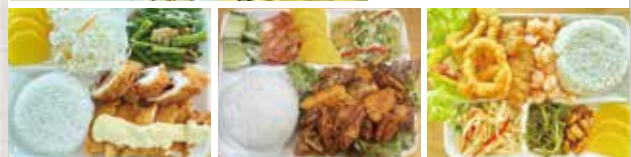
野菜も豊富なメニュー(両キャンパス共通)は7週間で1サイクル!