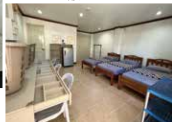
個室 B 共用スペースは 生徒同士交流の場