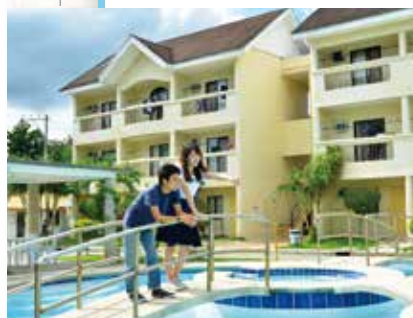
プールブリッジ & 寮外観