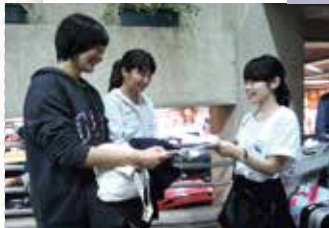
空港ピックアップ