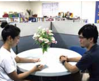
個別カウンセリング