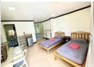
プレミアム個室・2人部屋

プレミアム個室は2人部屋を個室として使用。回線状況は日本よりやや劣りますが各階にWi-Fi有。