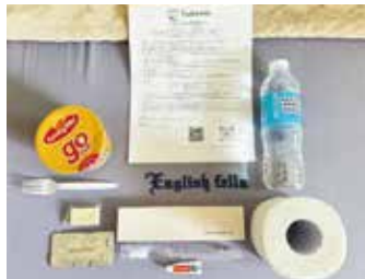
無料ウェルカムセット 空港などの送迎車