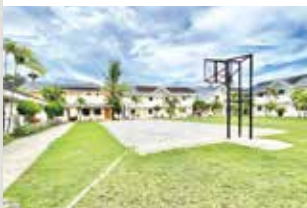
開放感溢れるキャンパス内

開放的な雰囲気です運動施設が完備され、生徒同士が交流しやすい構造は中長期留学生からも好評。