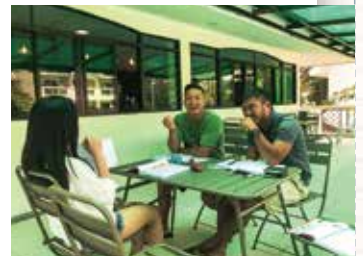
カフェでリラックス バスケットコート