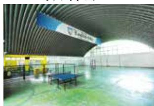
広い体育館 & ジムでリフレッシュ!