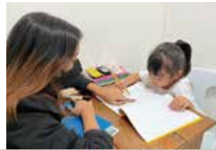
大人気の親子留学