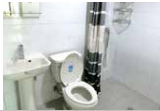
清潔感のあるバスルーム