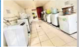
洗濯機利用 & 洗剤共に無料