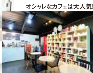
オシャレなカフェは人気!