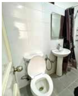
各室内 (個室 B 以外) の バスルーム